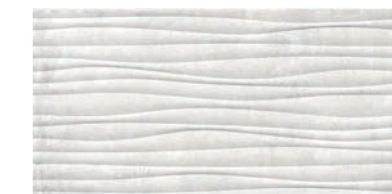
GAA 9101 jura grau matt strukturiert/ jura grey mat structured