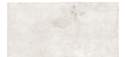
GAA 93 jura beige matt/ jura beige mat