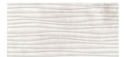
GAA 9301 jura beige matt strukturiert/ jura beige mat structured