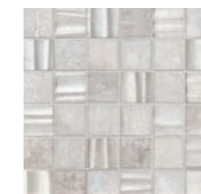
GAA 331 Mosaik Jura-Mix/ Mosaic jura-mix